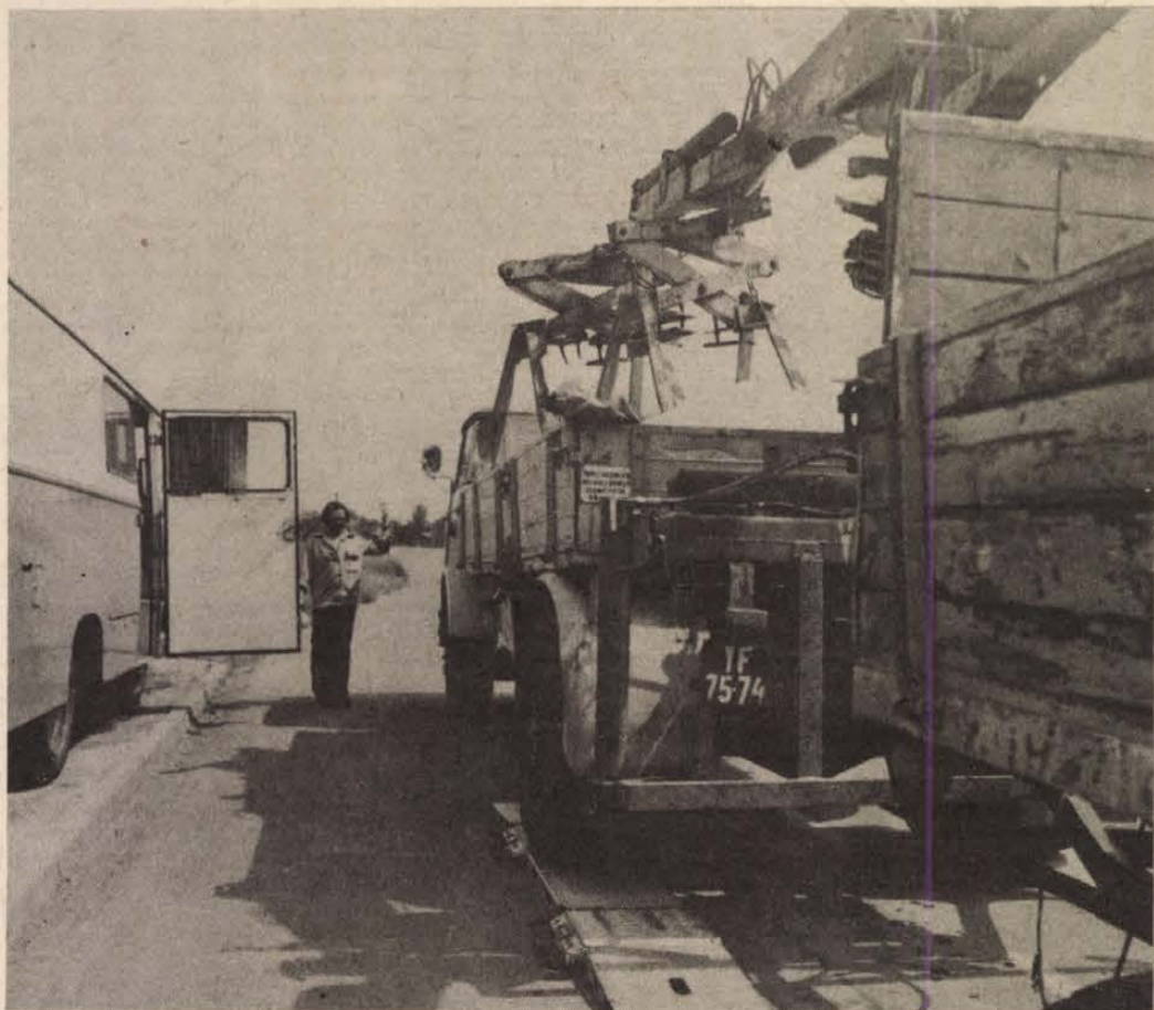
Ez év áprilisában a KPM Békés megyei Közüti Igazgatóságánál bevezették a közúton közlekedő nehéz gépjárművek tengelysúlyának mérését. A háromtagú, hatósági jogkörrel felruházott csoport munkáját mutatjuk be a lapunk 5. oldalán megjelenő riportban

A konzervipar legnagyobb tömegű áruja a paradicsom: 12 üzemben főzik a paradicsomot, készítenek belőle sűrítményt, ivólé. Az üzemek az első szállítmányokat már átvették. Ezekkel a legkorábban beérő fajtákkal járatták be gépeiket. A paradicsom fő szezonja 7–10 nap múlva kezdődik. A termés minőségével elégedettek a szakemberek. Az első konzervek minősége kifogástalan.